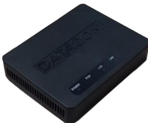
Figura 1 - DM985 - 100

O DM985 - 100B GPON ONU é um terminal de rede óptica em modo bridge L2 possuindo uma interface LAN Gigabit Ethernet. Na Figura 1 é possível verificar o modelo DM985 – 100.