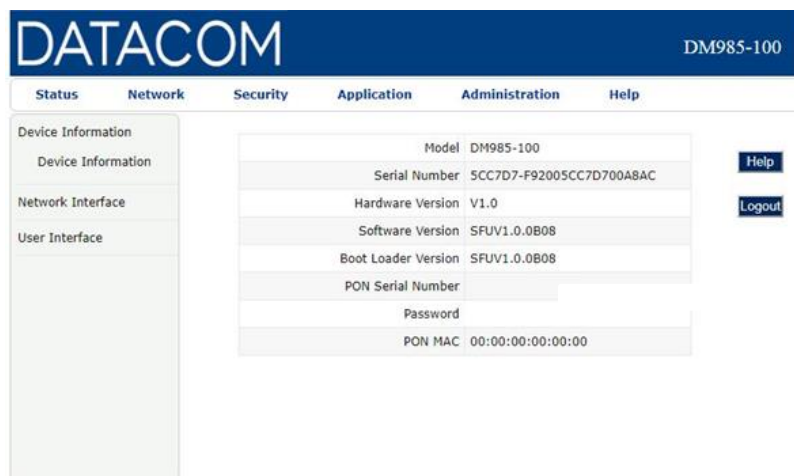
Figura 5 - Página Principal de Acesso Via WEB

A página principal do ONU apresenta o Menu de configuração na parte superior, bastando clicar no Menu desejado e seguir com as configurações avançadas.