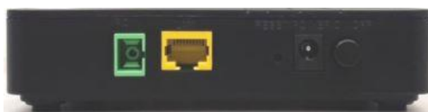
Figura 3 - Conexões do DM985 - 100

Os modelos do DM985 - 100 ONU apresentam as seguintes conexões: